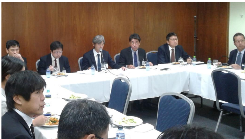
保前様の講演を興味深く拝聴する参加者